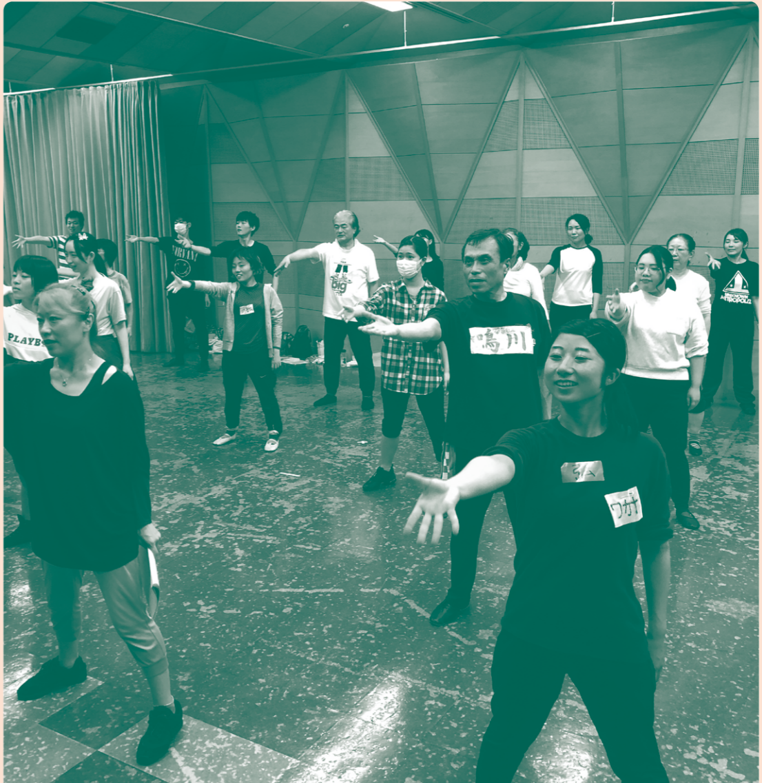
公演で集まった市民54名によるリハーサルの様子