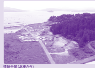
遺跡全景(北東から)

～7mの低地に立地する極めて海辺 に近い遺跡です。発掘調査では縄文 時代前期から晩期にかけての土器や 石器が大量に出土しています。 今回は前期から晩期の土器と石器、 装飾品など約50点を展示します。