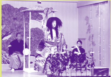
「枕草堂」友枝昭世所演

仙台市制百周年の1989年から9年間続いた「仙台 薪能」を引き継ぎ、能のシテ方に喜多流をむかえ た本格的な公演。人間国宝の友枝昭世と野村万 作が出演します。演目: 喜多流能「枕草堂」、和泉 流狂言「栗焼」、喜多流能「高砂」