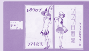
文化キネマウィークリー、文化キネマ入館券(半券)

その歴史的な役割を考えます。 (同時期開催) ●特別展「堤焼と堤人形」 ～4月12日(日) ●展示解説 4月4日(土)、12日(日)11:00～14:00～ ●季節展示「花見」 4月4日(土)～5月6日(水・休)