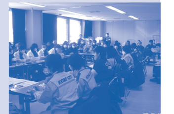
写真:東日本大震災時の保健師の活動の記録から